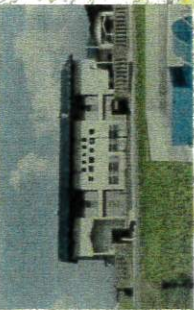
平沢用水機場(全景)