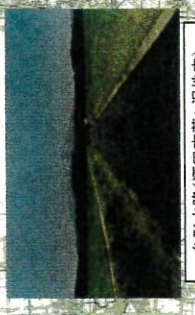
台形水路(酒田市老ヶ沢地区内)