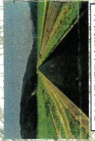
長方形水路(酒田市大州渡地区内)