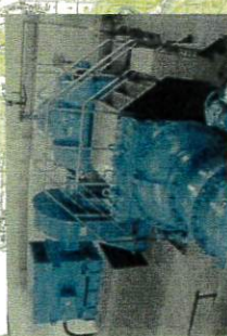
平沢用水機場(用水ポンプ)

被害箇所 草薙頭首工管理道路 一級河川最上川の増水による草 薙頭首工管理道路の崩壊