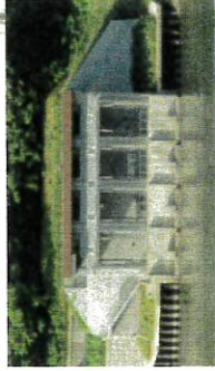
草薙頭首工(戸沢村柏沢地区内)