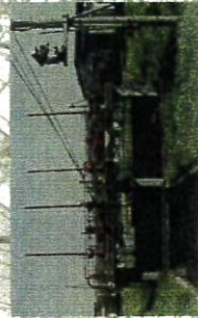
樽橋分水工(酒田市樽橋地区内)