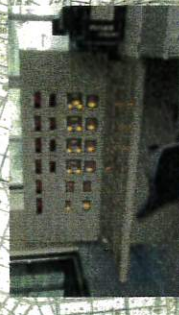
草薙頭首工(遠方操作室)