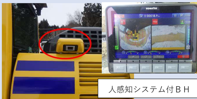
人感知システム付BH