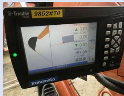
ICTを活用した軽減効果の発現