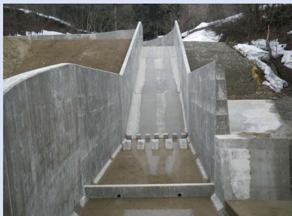
完 成 (洪水吐工)