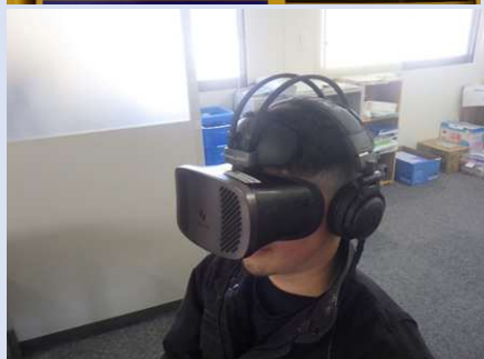
VRを活用した安全教育